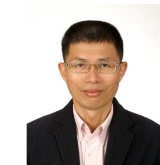
經歷：第三屆理事長 (谷橋工業 執行長)